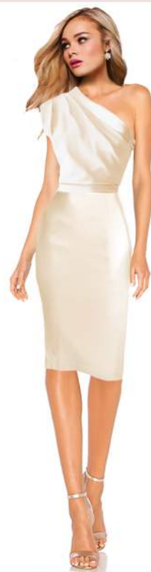
HOUSTON Art. Nr.: HBR0HOU-01 00-01