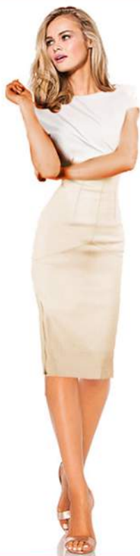
MINKA Art. Nr.: PRDOMEL-01 00-01-05